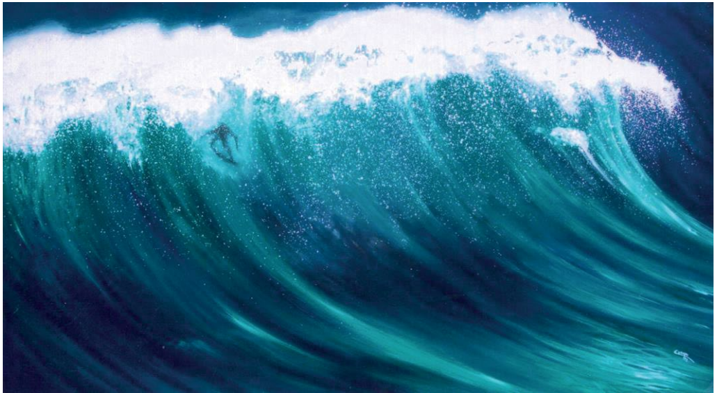
Άλμα | Leap, 1999

λάδι σε μουσαμά | oil on canvas, 180 x 100 cm