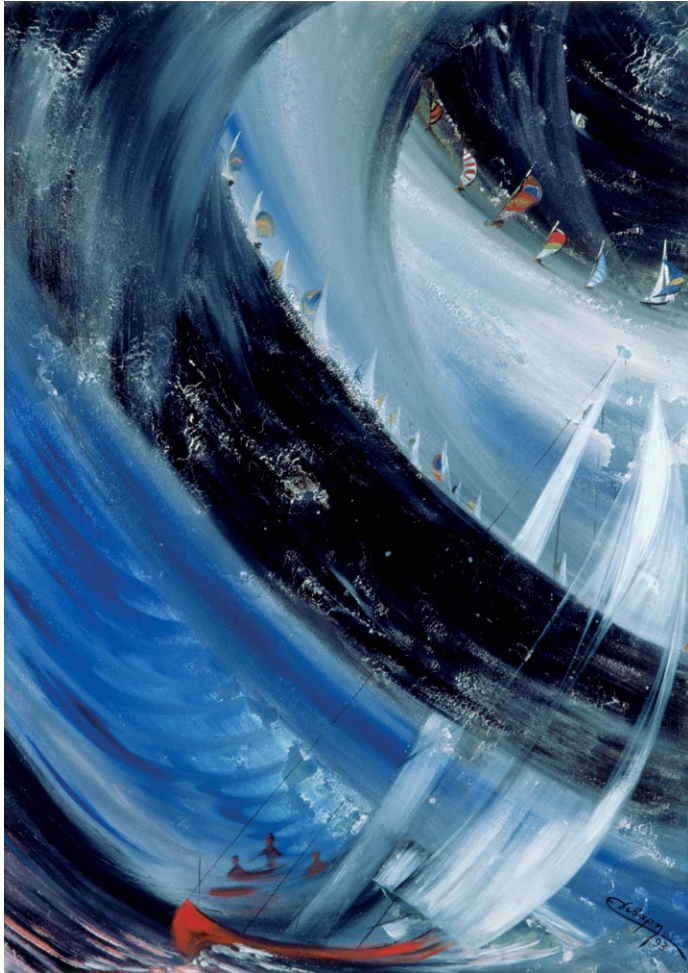
Διέξοδοι | Ways-Out, 1993

λάδι σε μουσαμά | oil on canvas, 100 x 140 cm