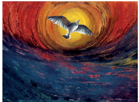
Επί-γνωση | Awareness, 2000 λάδι σε μουσαμά | oil on canvas, 140 x 100 cm

Είδα τη θάλασσα σε όλα της τα χρώματα και τις διαθέσεις, σε όλες της τις παραλλαγές. Την είδα και εκεί που ακουμπά τη γη, το χώμα, την άμμο, φλερτάροντας με την ξηρά. Είδα τη θάλασσα κίτρινη και μαβιά, στο βάθος εμείς να μας καταπίνει, σε ακτίνα του κυκλώνα τρομερή και το 'νιωσα στα βάθη της ψυχής μου, πως χάνομαι στην απεραντοσύνη. Εικόνες που αγάπησαν τα μάτια μου, αρρενωπές εικόνες που αγάπησε η θηλυκή ματιά μου.