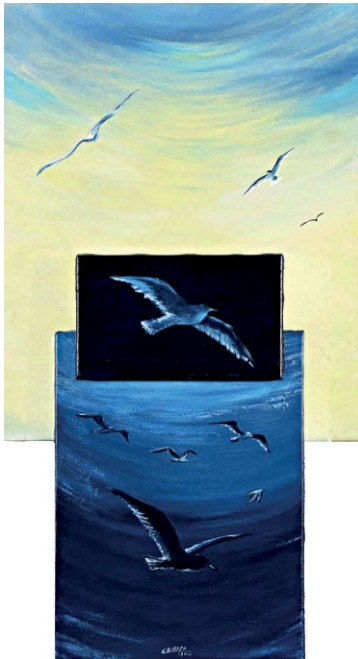
Νυχτώνει-Χαράζει | Night Falls-Day Breaks, 2000 λάδι σε μουσαμά | oil on canvas, 45 x 82 cm